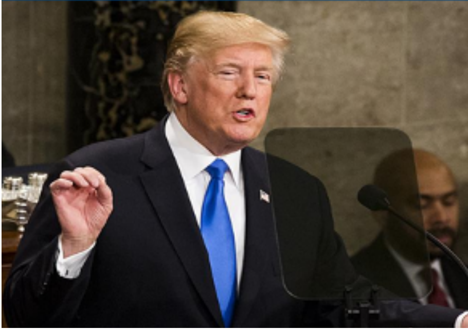
ABD'nin 45. Başkanı Donald Trump