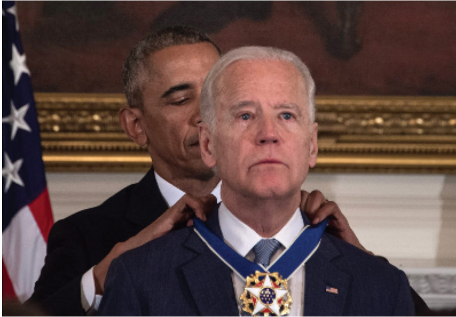
ABD'nin 46. Başkanı Joe Biden

(ABD Başkanı Barack Obama, yardımcısı Joe Biden'a ülkenin en yüksek ödülü olan Devlet Başkanlığı Özgürlük Madalyası'nı verdi (2017).