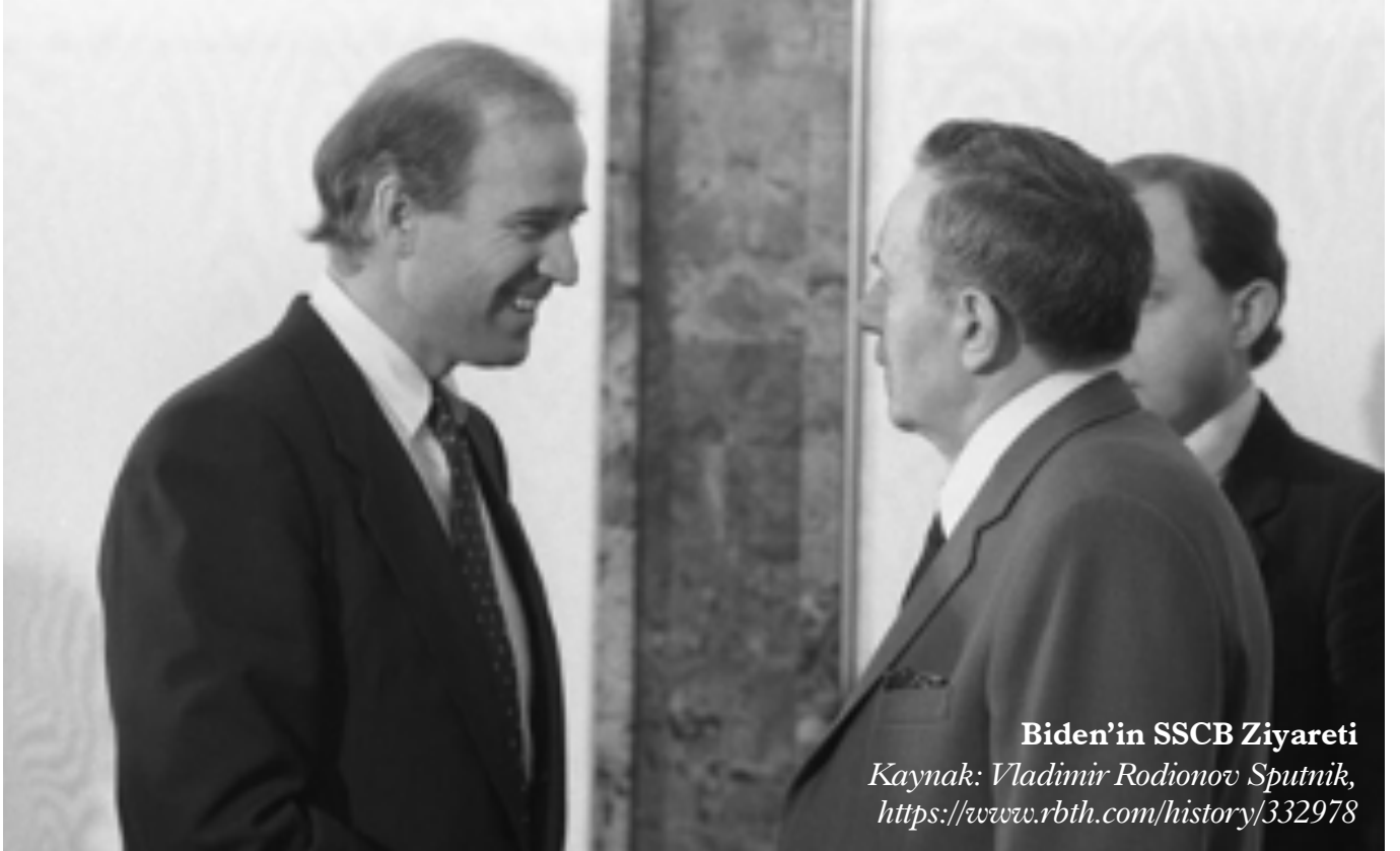
Biden'in SSCB Ziyareti