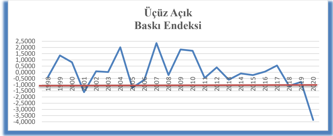
Şekil 3. Üçüz Açık Baskı Endeksi eşik değeri